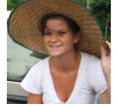
By: Cecilia Laseter