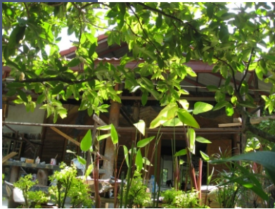
Baan Yuu Suk